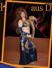
Kaschima aus Dresden