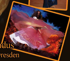
Sindus aus Dresden